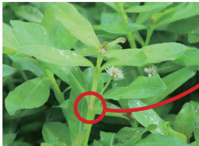
節は簡単にポキポキ折れる