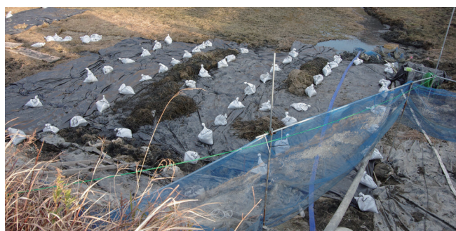
遮光シートやネットを用い、拡散を防ぎながら駆除をします

兵庫県 (078-362-3389) またはお住まいの自治体窓口にご連絡ください。