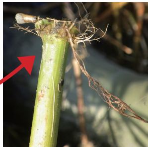
茎の節から再生する根