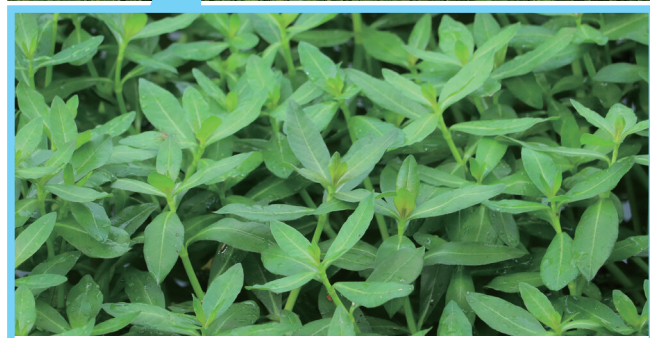
水上から陸上まで、容赦なく大繁茂します