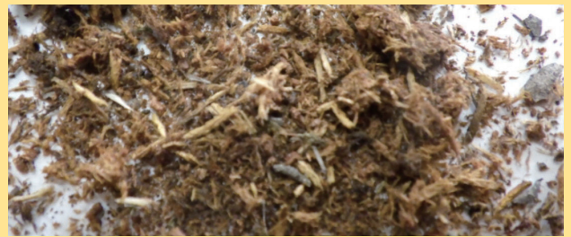
他種のフラス 繊維状の木くずが多く見られる