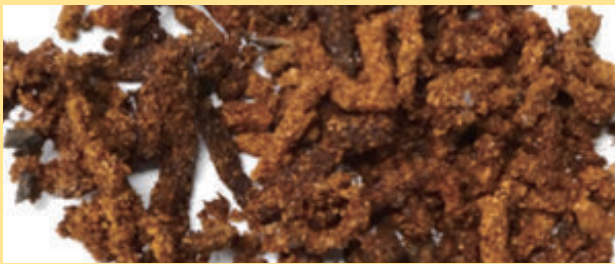
クビアカツヤカミキリのフラス 繊維状の木くずが見られない