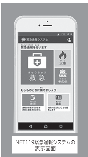
NET119緊急通報システムの表示画面