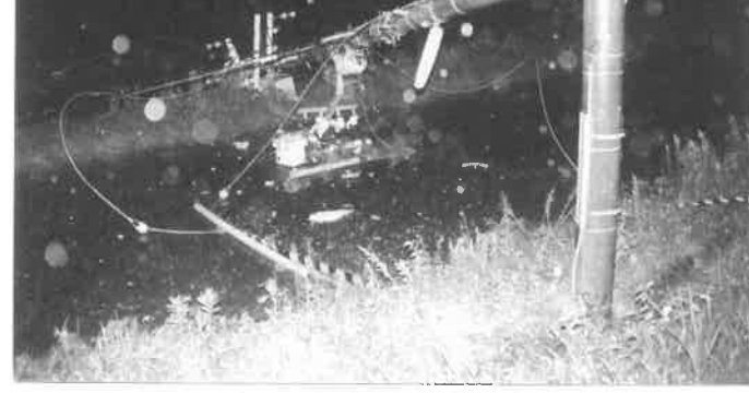
台風23号の暴風で折れた電柱(高田台)