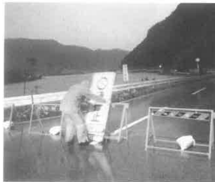
浸水に備え通行止になった川沿いの県道(岩木)

主避難されたり、隣近所で誘い合わせて土のう積み作業をされたりしていました。また、堤防には頻繁に川の水位を確認する人の姿が見られました。 幸い、今回の23号においては町内に大きな被害はありませんでしたが、暴風により一時停電があったり、県道5号線が崩れにより通行不能になるなどの交通への影響がでました。