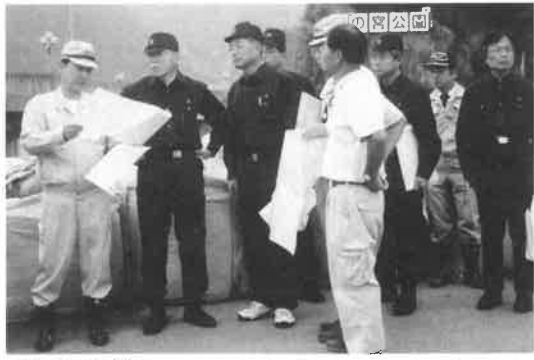
井戸知事(左から2人目)が台風21号の被災地域を視察