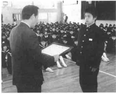
災害復旧への全校あげでの取り組みに感謝