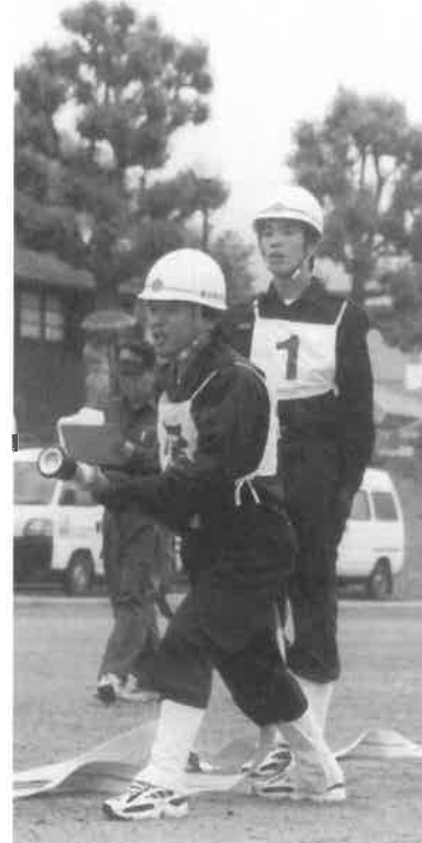
雨の中の披露となった準優勝の金出地分団