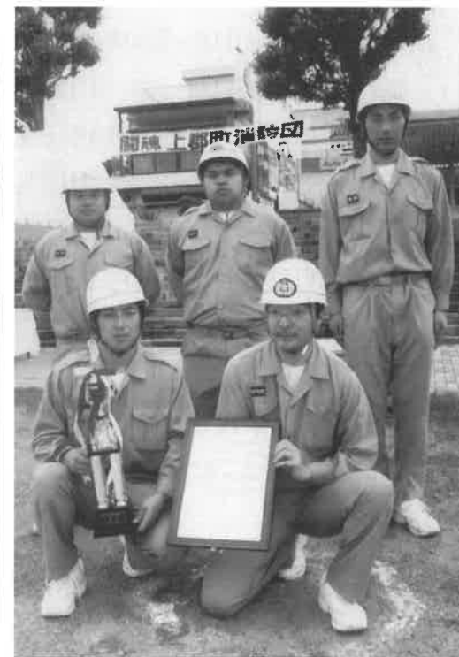
西播磨大会出場となった西部分団のメンバー