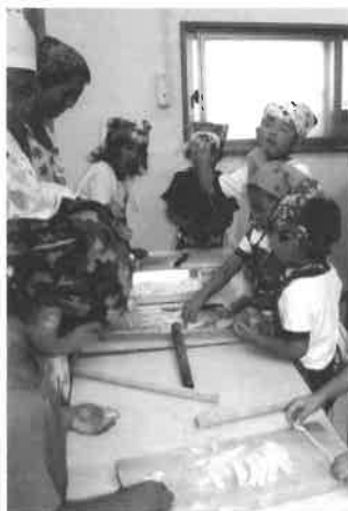
プール掃除もお料理もみんなですると楽しいね