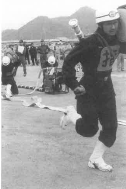
確実な動きの野桑分団は3位入賞