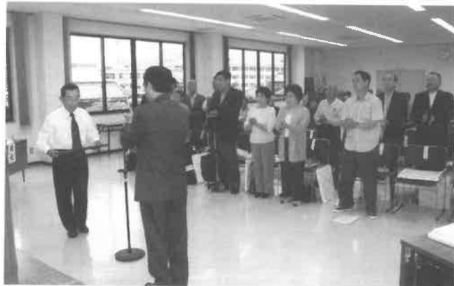
41年連続完納で優良表彰を受けた広根納税組合