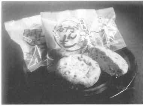
▲具だくさんの「丸心がんも」は1個210円でJA兵庫西Aコープ上郡店で販売されています。

平成14年2月に発足した「上郡町特産品づくり委員会」で、「町内の農水産物を活用した特産品の開発を」と研究を重ねて商品化されたのが、今回紹介する「丸心がんも」です。 上郡町では耕地面積の約1割で大豆を栽培、生産しています。この栄養価の高い良質の大豆と、全国名水百選に選ばれた千種川の水で作りに上げた豆腐をベースに、具にニンジン、レンコン、キクラゲ、シイタケ、ゴボウ、