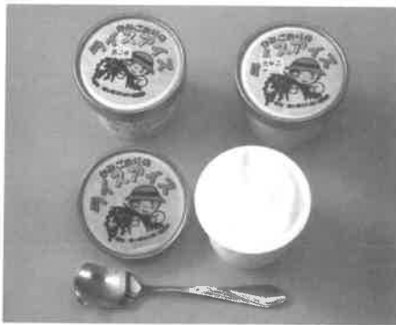
黒ゴマやきな粉風味もある「ライスアイス」は120ml入り1個300円

ゴールデンウィーク中の5月3日に 行われた「梨ヶ原ふれあいまつり」 の会場でも「ライスアイス」は好評。 京阪神からのお客さんが地元産の 野菜とともに買い求めていました。