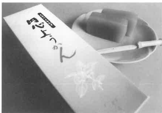
「円心ようかん」は野菜の口箱。野菜モロヘイヤと呼ばれる。1箱1,000円

平成12年4月から上郡町菓草研究会が中心になり研究開発を進めてきたモロヘイヤ入りのよつかんは、鎌倉、室町時代の播磨の武将・赤松円心から名をとり、「円心ようかん」として平成12年10月に商品化されました。モロヘイヤを使った特産品としては、上郡町にはせんべい、うどんがあります。また、4月号のこのコーナーで紹介しまし