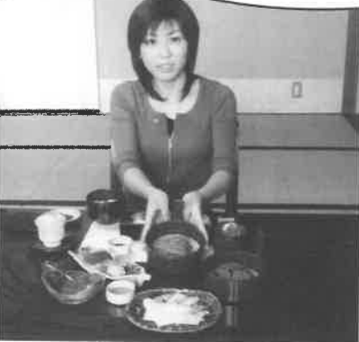
▲夏は2種類の冷麺で！「味夏の膳」