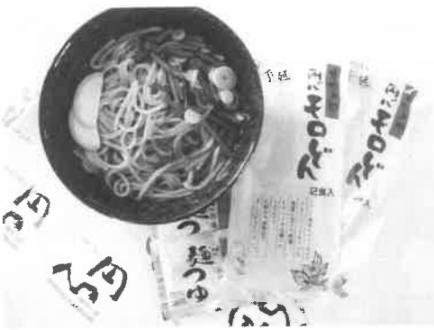
▲ご土産用に箱入りの半生麺（つゆ付き）もある円心モロどん。町内では駅前の観光案内所や楽房円心、ゴルフ場などで販売されています。

「円心モロどん」は、商工会が、「むらおこし特産品」のひとつとして野菜の王様と呼ばれ