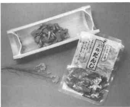
特産の「上郡だんじ」は100グラム入りで、味付けは、しょう油、しょうが、塩の3種類。

生産者のYS-24グループは、山野里小学校を昭和24年に卒業した方の集まりで、普段は野菜作りなどもされています。