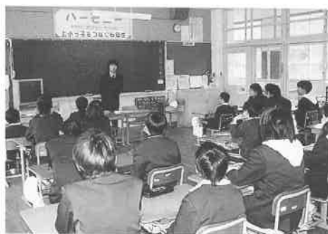
税金の必要性と使いみちを学ぶ小学生