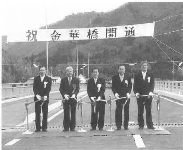
▶式典後のテープカットの様子

2月7日(土)、町道苔縄柏野線の金華橋完成を祝う竣工式が地元自治会並びに県と町、工事関係者などが集まり行われました。 上流側の歩道を含める幅員10m、延長151mのこの橋は、苔縄側の町道拡幅工事に合わせて平成10年度より事業に着手、この度晴れて完成に至りました。 冬空の下でおそかに行われた式典の後、苔縄や柏野などの住民が見守る中、町長、議長、西播磨県民局土木整備部長と地元自治会長による待望のテープカットが行われました。