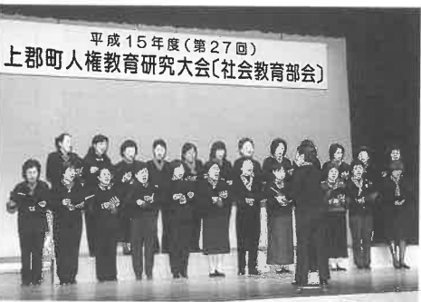
婦人会が「明日があるさ」の替え歌を披露

2月22日(日)、満席の中央公民館大ホールで上郡町人権教育研究大会(社会教育部会)が開かれ、今年度指定の上郡校区の自治会、老人会、婦人会、幼・小・中学校のそれぞれのPTAが、1年間の取り組みを実践発表しました。 「ふれあいの輪を広げるまちづくり」をテーマとし、11月に行われた「浪漫街道夢フェスタ」で世代を超えて協力し合ったことや、地域での人権学習会や交流に取り組んだ成果などが報告されました。