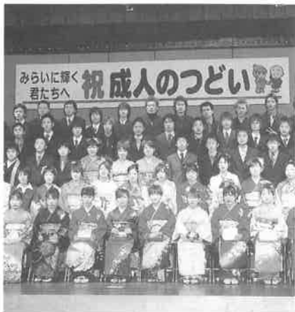
懐かしい顔ぶれと記念撮影