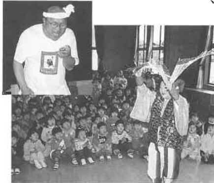
全国の幼稚園などを回っている「げんさん」(左上写真)

1月16日(金)、山野里幼稚園の遊戯室で、今春入園の幼児と保護者を園に招いて、在園児との交流会が開かれました。