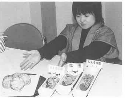
晴れて発表となった「円心がんも」(左端)と「上郡だんじ」

円心太鼓や大道芸など多彩な行事が展開され、訪れたお客さんは楽しい1日を過ごしていました。