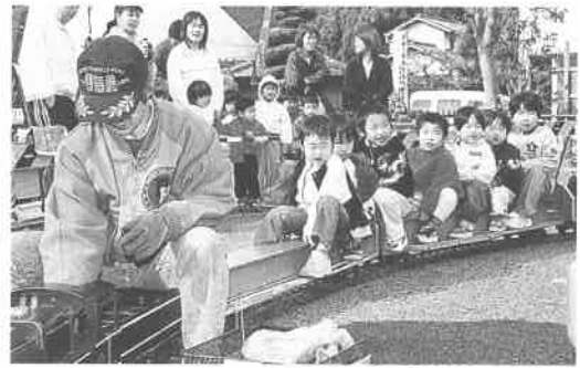
子どもたちに大人気のミニSLランド

10月26日(土)～11月26日(日)の1ヶ月にわたって中央公民館とつばき会館を会場に上郡町文化祭が開催され、文化協会を中心に、文化の秋、芸術の秋にふさわしい多彩な展示や芸能の披露がされました。期間中の11月2日(土)には、大ホールでの文化協会発表会をはじめ、茶会や生花、花木、盆栽の展示が行われました。