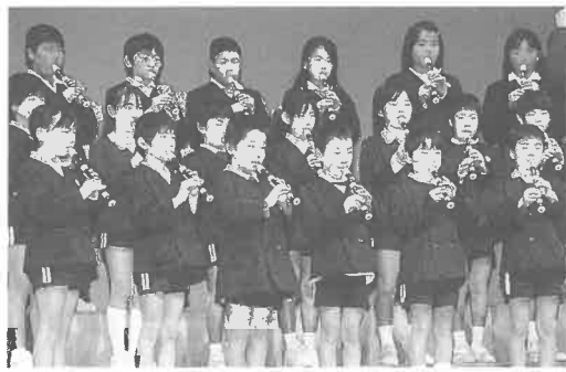
上郡小学校4年生のリコーダー奏

11月13日(水)、中央公民館大ホールで「赤穂郡小・中学校連合音楽会」が行われ、町内の小、中学校から学年やクラブ単位で代表出場した児童、生徒が各校で取り組んできた合唱や演奏を披露しました。全員でのリーダー演奏や手話をしながらの合唱などがあり、音楽の楽しさを実感できる音楽会でした。