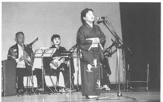
船坂民謡愛好会の発表(文化協会発表会)

10月26日(土)～11月26日(日)の1ヶ月にわたって中央公民館とつばき会館を会場に上郡町文化祭が開催され、文化協会を中心に、文化の秋、芸術の秋にふさわしい多彩な展示や芸能の披露がされました。期間中の11月2日(土)には、大ホールでの文化協会発表会をはじめ、茶会や生花、花木、盆栽の展示が行われました。