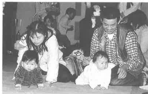
赤ちゃんのかわいいしぐさになごんだハイハイ競争

11月4日(日)上郡町保健センターで、第17回健康福祉まつりが各種団体協賛のもと、開催されました。人気の赤ちゃんハイハイ競争をはじめ、お口の相談、栄養コーナー、作品展や写真展のほか、屋外では健康チェック、模擬店、ミニSLランドなどが行われ家族で楽しみながら健康を考える行事となりました。