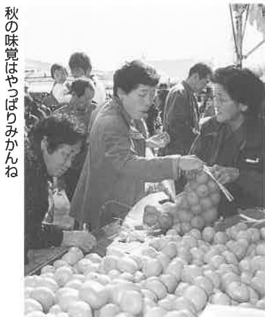
秋の味覚はやっぱりみかんね

暖かな秋晴れの一日となった11月10日(日)、商工主催の「第13回上郡町商工まつり」が役場前広場で盛大に開催されました。地元商店が日頃のご愛顧に感謝することをおまつりでは、町内商店で買い物した際にポイント券をためて抽選する「円心くんカードの抽選会」や地元小学生がケーキ、ポップコーンなどを販売する「キッズマーケット」、