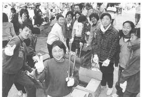
小学生の焼いた焼きそばはいかがですか!!

ドの特設ステージでは太鼓の演奏や合唱、地元の獅子舞などが披露されました。また、会場を囲むフリーマーケットでは、餅つきや焼きそばなどの食べ物のほか、バザー品や花苗の販売が出店され、時おり冷たい風が吹く天候でしたが、地域が一体となった心温まるまつりになりました。