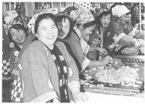
笑顔あふれる焼きソバ販売コーナー