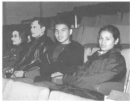
音楽会を楽しんだタイの学生と先生

また、会場の客席では、タイ王国からの学生と随員の先生4名が、音楽を鑑賞していただきました。