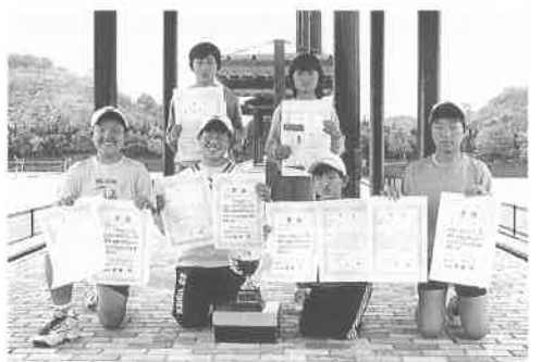
好成绩の上郡ジュニアソフトテニスクラブのメンバー(因島運動公園にて)