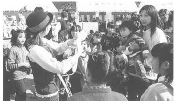
大道芸の風船パフォーマンスに注目する子どもたち

暖かな秋晴れの一日となった11月10日(日)、商工主催の「第13回上郡町商工まつり」が役場前広場で盛大に開催されました。地元商店が日頃のご愛顧に感謝することをおまつりでは、町内商店で買い物した際にポイント券をためて抽選する「円心くんカードの抽選会」や地元小学生がケーキ、ポップコーンなどを販売する「キッズマーケット」、