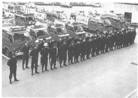
パレード前に役場駐車場に整列する消防団

火災が多発するシーズンを前に、赤穂市消防署上郡分署と上郡町消防団は、11月4日(月)午前中、「火の用心」の横断幕を掲げた消防車など14台で町内全域を巡回し防火を呼びかけました。また、同日開催していた健康福祉まつり会場では、消防団員57名が献血に協力しました。