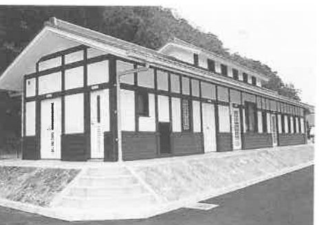
完成した高山浄化センター

人、一日当たり75・6トンの処理能力を持っており、11月1日より使用開始になりました。高山浄化センターの完成により、全町11地区に農業集落排水処理施設が整備され、これにより町内に計画していた13ヶ所の下水道処理場が全て完成したことになります。