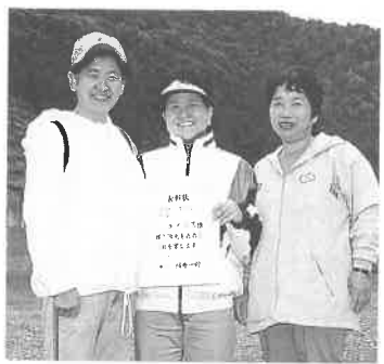
見事優勝のコスモスチーム

10月27日(日)、町民体育大会の一環として「町民ウォーキング大会」が上郡森林体験の森(山野里)で行われ