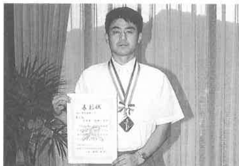
剣道一筋26年の稲田教諭

8月11日(日)、兵庫県立武道館(姫路市)で開催された(財)全日本学校剣道連盟主