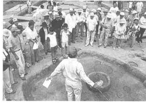
粘土塊が発見された竪穴式住居跡

兵庫県西播磨県民局 企画調整部 調整課 〒678-1205赤穂郡上郡町光都2-25 ☎58-2112/2113 ☎58-2328 ホームページアドレス http://web.pref.hyogo.jp/nishiharima/