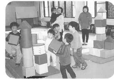
みんなで遊ぶとやっぱり楽しい!