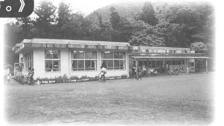
子育て学習センターは親と子、子と子、そして親と親の交流の場。