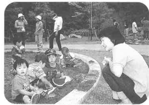
すこやか子育て教室の野外活動

【活動2】 子育て情報の発信：本広報紙への隔月掲載、子育て通信「ほほえみ」の発行（講座生、各地区公民館、保健センター、西播磨県民局などに配布）など、家庭、地域社会にむけて、定期的な子育て情報の発信をおこなっています。