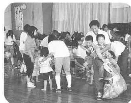
高校生のお兄さん、お姉さんとあそんだよ。

【活動3】 子育て講座の実施：0歳児から就園前の子育てをしている両親、祖父母が講座を受講し家庭での教育力を高めています。 ①『すこやか子育て教室』 平成13年度は、全員の集い、校区別の集い、グループの集い、年令別の集い、