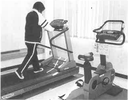
新しく入ったランナー(左)とバイク(右)その他のトレーニング設備も充実しています

トレーニングルームの使用料は、午前九時から午後五時までは一人二百円、午後五時以降は一人三百円になります(一回二