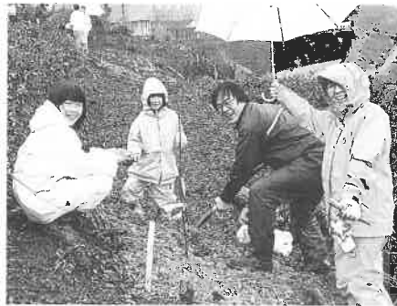
雨の中家族で協力して植え付けました

二百名が会場に集まりました。雨具を着た参加者は、桜の根付きが良いように、特殊な土壌改良剤や肥料を混ぜた土づくりから行い、森林組合スタッフからの協力でスコップを手に、桜の木を植え付けていました。また、桜の横に設置する丸太でできた