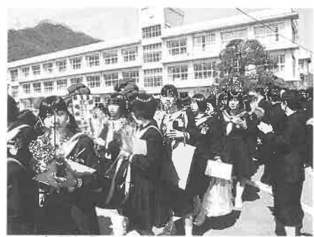
3年間を過ごした校舎ともお別れです

式典では、厳肅な雰囲気の中、学校長や各来賓からお祝いの言葉が述べられ、在校生からの送辞がおくられました。続いて卒業生代表により中学校時代の思い出や、先生・保護者への感謝の思いを込めた答辞が読まれると、感動につつまれた会場のあちらこちらにハンカチで目頭を押さえる様子が見られました。式典の終わりには、卒業生一人