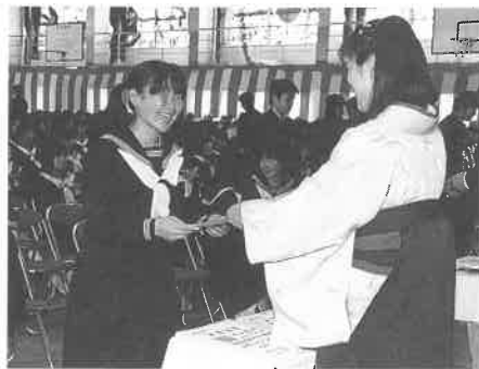
一人ひとりに手渡された卒業証書

三月十四日(水)上郡中学校で第四十一回卒業証書授与式が行なわれ、男子百二十九名女子百三