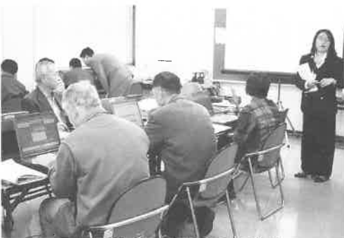
真剣な表情で取り組む受講者の皆さん

お持ちのパソコンでインターネットがつけられるようにした方もおられたようで、受講者同士で電子メールアドレスの交換をされている方も見うけられました。