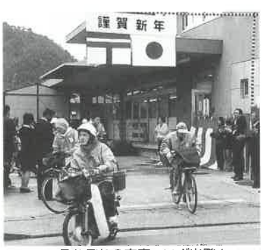
それぞれの家庭へいざ出発!

式典に引き続き、出発を祝してテープカットが行なわれ、年賀状を満載した自転車やバイクにまたがった配達員の方々がゲートをくぐり出発しました。