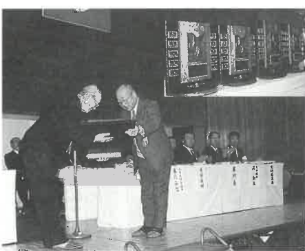
長安会長(中央)から町長へ手渡された盾(右上)

には総理大臣杯を授与されるトーナメント戦が行われました。最終日の開会式の席上で上郡町ライオンズクラブの長安会長からクラブ結成二十五周年を記念して男女団体戦の優勝盾と準