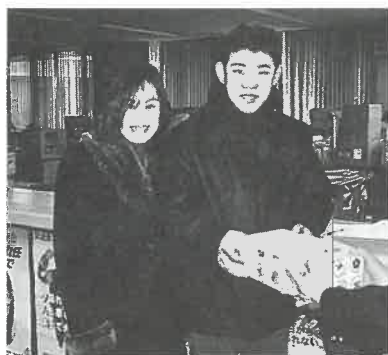
おふたりともお幸せに!

今年から二十一世紀になることもあり、節目の一月一日(祝)に上郡町で婚姻の届け出をされたカップルは通常より多い七組もありました。