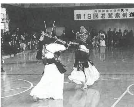
手に汗にぎる白熱した攻防

優勝盾が寄贈されました。盾は、中央の若鷲をあしらったプロンズ製のレリーフが印象的な立派なものです。