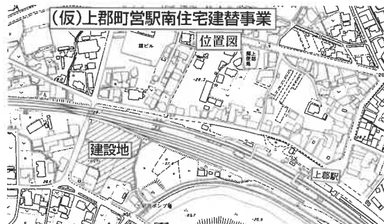
(仮)上郡町営駅南住宅建替事業

頃の予定で、上郡駅に近接するこの最新の住宅の完成により、町内の若年層人口の定着と、それに伴う町全体の活性化が期待されます。