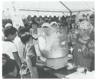
わたがしにも長い列ができました

うどんや、ぜんざい、やきそば等の模擬店、福引大会等が行われ、訪れた方々が長い列を作りました。また、同時にリサイクルバザーも行われるなど会場で行われた様々な行事にたくさんの方々が参加しました。