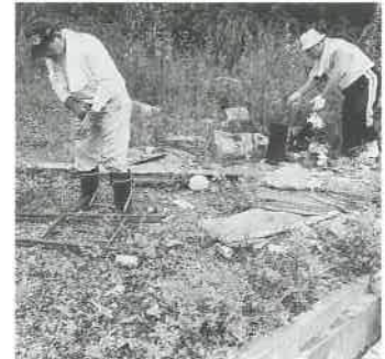
道端に散乱するゴミの山

出地からテクノまでの県道沿いと、船坂地区の鳳宮池付近等で行いました。ごみの中には空き缶や空きビンなど小さな物だけでなく自転車やテレビ、ストーブ、タイヤなど明らかに家庭の粗大ごみや廃棄物を捨てているケースが見られ、そのマナーの悪さには驚かされました。ときおり小雨が降るあいにくの天候の中、二時間ほど集められたごみの量は、トラック四台分にもなりませんでした。ごみの不法投棄は処罰対象になり、ごみの不法投棄は処罰対象になります。私たちの美しいふるさとを守るために、ごみを捨てる現場を見かけられた方は、最寄りの警察署、駐在所若しくは役場住民課環境衛生係までご一報、くださいますようお願いいたします。