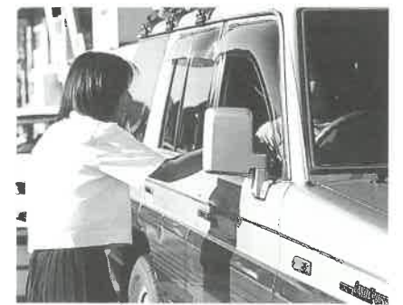
安全運転をお願いします!

九月二十一日(水)から三十日(土)まで秋の全国交通安全運動が実施されました。町内でも各種団体の協力のもと、交通安全啓発