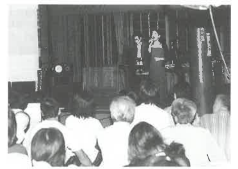
「蘇州夜曲」など月にまつわる唱を披露

九月十六日(土)Spring 8に勤務されている方々で構成される軽音楽部によるコンサート「月光音楽会」が金出地の浄光寺で開かれました。