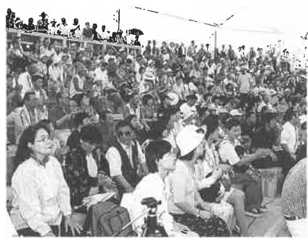
大勢の方が集まりました

六月十八日(日)淡路島のジャパ ンフロア2000の会場で 「市町の日・上郡町」が開催され、 円心太鼓のメンバーが参加しま