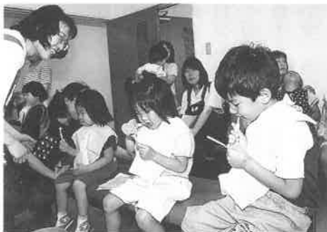
上手にみがけたかな?(ブラッシング指導)

六月四日(日)、歯の衛生週間に ちなみ、保健センターで歯の健 康まつりが開催されました。 これは、身体の成長や健康管 理に歯が重要な役割をはたして いることを理解していただくた めに毎年開催されているもので、 今年も親子づれを中心に約五百 名が訪れました。 午前中つばき会館で四・五歳 児を対象としたむし歯のない子 の表彰が行われました。該当児 九〇名中七十一名が出席し、順 番に名前を呼ばれて表彰を受け ました。 そのほか、歯科医師による歯