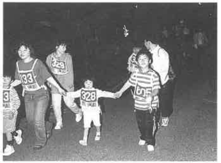
疲れも見せずに元気に歩きました!

六月三日(土)上郡小学校から野 桑の今川公園を折り返す約七km の夜間ハイキングが行われまし た。このハイキングは「人権文 化創造活動」の一環で、地域の 人々との交流とふれあいを目的 に、五年前から「きょうみしん しんひまわり隊」と東町総合セ ンターが始めたものです。初年 度は百名程度だった参加者も、 年を重ねるごとに増え、今回は 約三百名の参加者が集まりまし た。 今年も、例年にも増して鞍居 川周辺にホタルの乱舞が多く見 られ、参加者全員が幻想的な体 験ができました。また、小学校 にゴールしてからスタッフが用 意した「ぜんざい」など暖かい