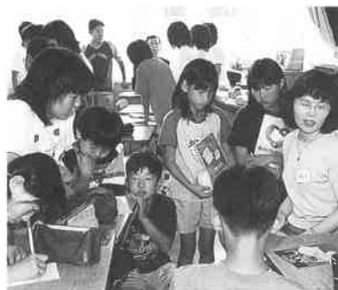
みんなで取材して新聞を作りました

これは、高田校区にお住まい のいろいろな職種の方に小学校 の教室で職業上のご苦労や楽し いお話などを話していただくも ので、社会への開かれた目を養