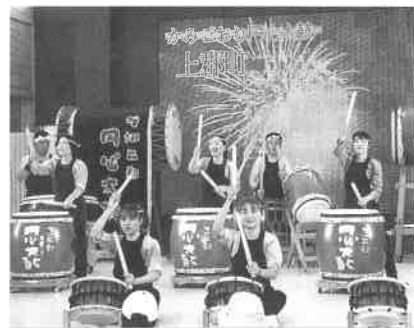
会場と一体になった「熱い」演奏

した。「市町の日」は、県内の 市町が郷土芸能や観光イベン トを実施し、市町のPRを行う日 で、当日は、赤穂市、佐用町、 上月町とともに上郡町もイベン トに参加しました。 当日は、汗ばむほどの好天に 恵まれ、入場者も大変多く、会 場のふれあいステージには、定 員二百名以上ある座席に座りき れないほどのお客さんが集まり ました。 町長の挨拶に引き続いて演奏 した円心太鼓は、大変な盛り上 がりを見せ、太鼓の演奏にあわ