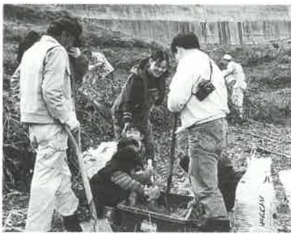
家族で協力して土づくりから

三月十二日(日)ピュアランド山の里東側斜面で桜の植樹会「SAKURA2000」が開催されました。これは、ピュアランド周辺を「一目千本桜」という桜の名所にする事業の一環で、