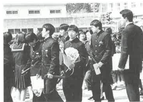
在校生らに見送られて卒業しました