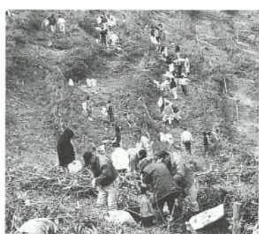
大勢の人が参加しました

事前に申し込まれた方など百二十組約三百名が午前と午後の二班にわかれて六種百二十本の桜を植樹しました。 植樹は、より桜に親しんでもらうため、たい肥と山土などを混ぜる土づくりから始められ、参加者は、なれない手つきでスコップなどを持ち、森林組合の方に方法を教わりながら、熱心に作業を行ないました。前日の雨で、午前中は足元がぬかるんでいるところもありましたが、好天のもと、家族で協力しながら植樹する様子があちこちで見られました。 また、桜のとなりに打ちこま