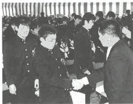
お世話になった先生と別れの握手