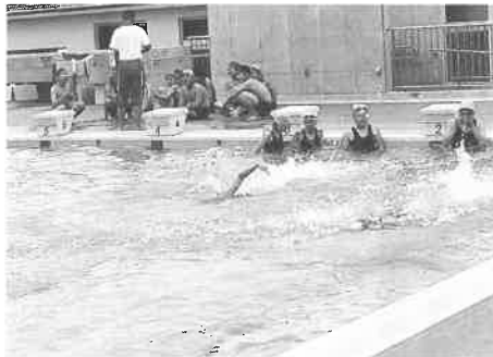
授業を受ける生徒達

プールは25m×7コースの大きさで、車椅子でも更衣室からプールサイドまでスロープで入ることができるようにになりました。また、プールの改築と同時に