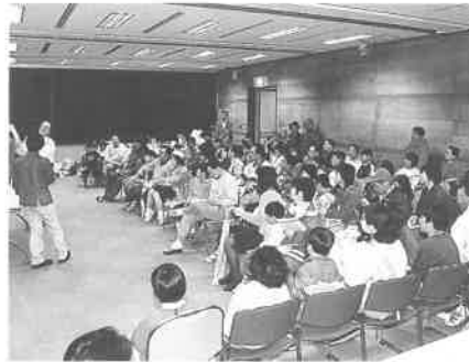
「光の不思議」の実験教室

このほか、光都プラザ内のオ プトピアでは立体映像の上映、 特設会場での特産物の販売、先 端科学技術センターではセミナ ーが行われるなど、多くの人が 科学と触れ合う楽しい1日を過 ぎされました。