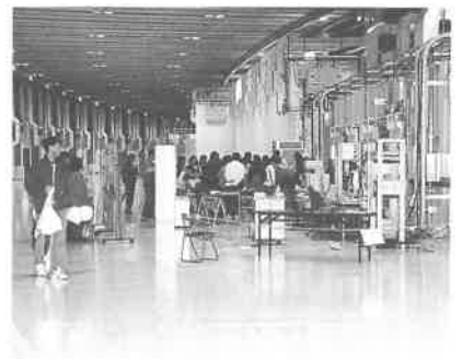
実験ホールの内部

普段立ち入ることのできない Spring 8内の実験ホール では、研究内容等の説明がビデ オや模型等を使って行われ、熱 心に職員に説明を求める姿も見 受けられました。また、小中学 生を対象とした実験教室も行わ れました。