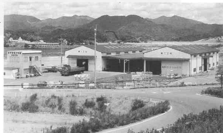
田中金属工業株式会社 宿毛工場▶