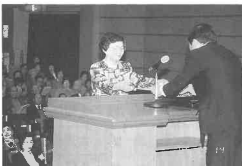
各講座の代表者が修了証書を授与

ョンとして、歌や詩吟、ダンス、謡曲など、老人大学でのクラブ活動の成果が披露されました。