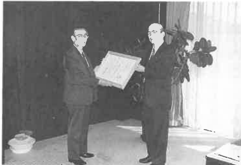
福井町長から名誉町民の称号が手渡されました

また、潤いのある町づくりのために、桜の植樹等全町公園化事業を積極的に進められ、さら