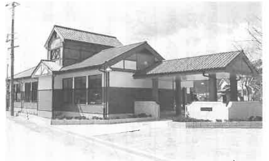
木の温かみにあふれた新園舎

昨年の八月に工事が開始されて以来、園児たちはプレハブの仮園舎で過ごしてきました。卒園前に園舎が完成し、一番最初に地元のお年寄りを招き交流会を行うなど、みなさん、喜びもひとしおでした。