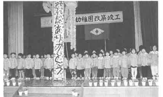
園児たちのくす玉割りで完成を祝いました