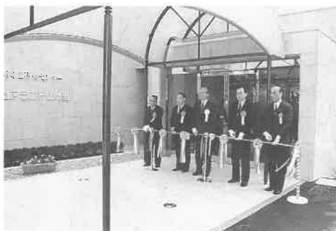
完成を祝うテープカット

待する声が多く聞かれました。三日の開館以来、多数の方々にご利用いただき好評をえています。今後ともよろしくお願います。