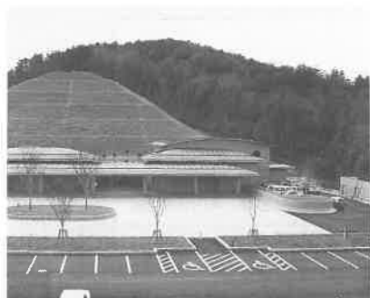
西播磨高原斎場「こぶし苑」

新宮町・上郡町・三日月町衛生施設一部事務組合が、播磨科学公園都市内に整備を進めていた斎場がこのほど完成し、四月一日から業務を開始しました。同斎場は、無煙、無臭、無公害の煙突のない美しい建物で、