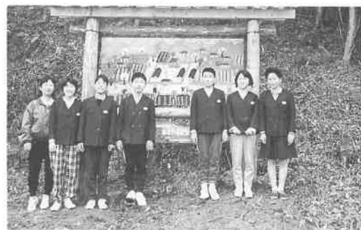
完成した看板の前で記念撮影