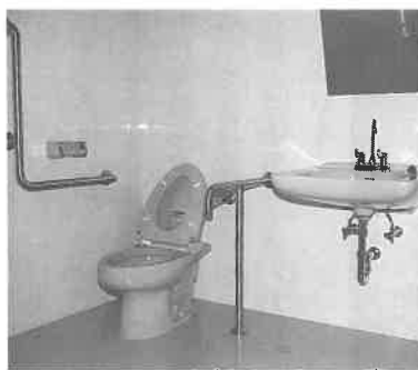
身体障害者の方も泊りいただけます