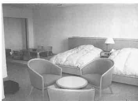
特別室(和・洋風兼用)