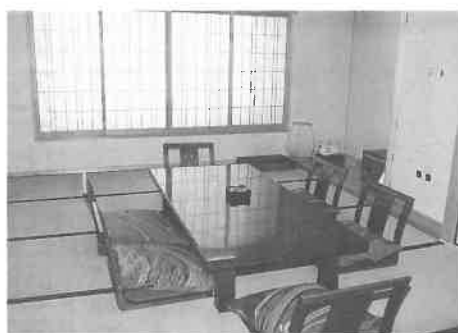
和室(各部屋ごとに趣向をこらしています)

適です。 その他、施設の隣には、弥生 墳丘墓の井の端遺跡公園が整備 されています。また、大池の艇 庫では、シーズン中にカヌーや ヨットを利用することもできま す。