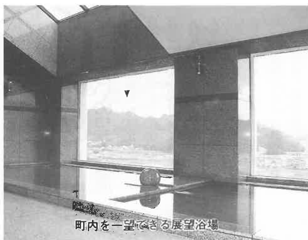
町内を一望できる展望浴場