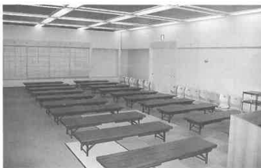
大研修室(座敷にも早変り)

適です。 その他、施設の隣には、弥生 墳丘墓の井の端遺跡公園が整備 されています。また、大池の艇 庫では、シーズン中にカヌーや ヨットを利用することもできま す。