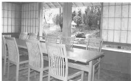
レストラン(御座敷もあります)