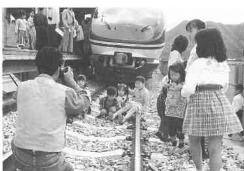
スーパーはくとの前で記念写真

「スーパーはくと」を見学しようと、家族連れや鉄道ファンなど約五百人が参加しました。