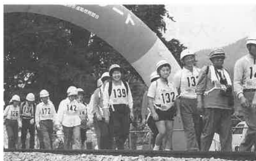
線路を歩く参加者たち