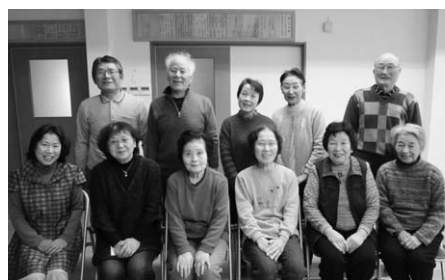
↑隈見町シニアクラブ（井上区公民館）