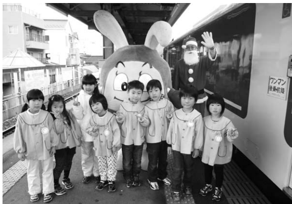
↑サンタさん、智頭急行マスコット「スーパーはくとくん」と写真撮影♪

園児たちは、イルミネーションで装飾された列車内で、クリスマスソングを歌ったり、サンタさんからプレゼントをもらったりして、いつもとは違う列車で楽しいひと時を過ごしました。トンネルを通ると車内はイルミネーションの美しい光がキラキラと浮かび上がり、園児たちは「わー！きれい」と歓声を上げていました。