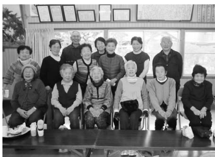
↑極楽会（下中野公民館）