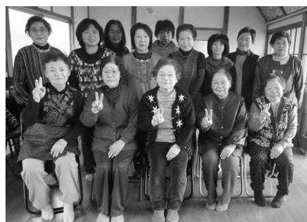
↑佐用谷サテライトクラブ（佐用谷公民館）