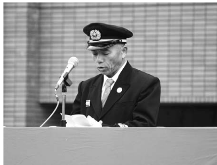
↑松本団長による訓示