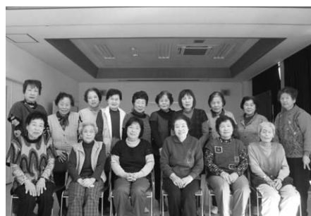
↑元気アップの会（鞍居公民館）