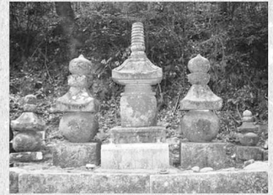
↑西方寺上の石造宝塔・五輪塔 （船坂公民館から、西方寺上の石造宝塔・五輪塔へは徒歩約30分）

※「別所城跡」「別名城跡」「大聖寺山城跡」については『上郡町史』第一巻と第三巻、「西方寺上の石造宝塔・五輪塔」「皆坂の地蔵像板碑」については第二巻（各5,000円）に詳しく記されています。