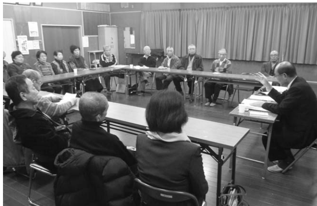
↑高田台自治会館で行われたふれあい町長対話室（1/8）

ヤコフさんは、上郡高等学校で茶道を体験したり、播磨科学公園都市の施設を見学したりして、日本の文化にふれていました。