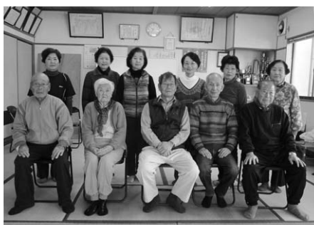
↑上町老人クラブ（上町公民館）