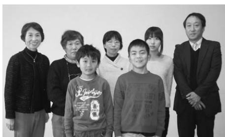
↑里親里子の皆さん

里子となった児童たちは、「買い物に出かけたりして、楽しく過ごせた」と嬉しそうに思い出を話していました。また、里親となった方は「今後はもっと里親さんが増えていけばいいと思います」と話していました。