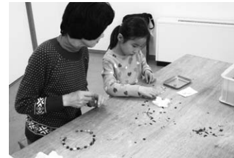
↑バーナーでガラスを溶かしてガラス玉を作ります。