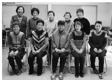
↑小山元気アップの会（小山公民館）