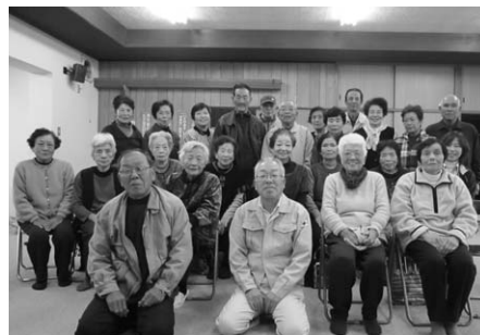
↑赤松老年クラブ三一会（赤松自治会公民館）