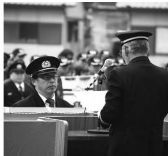
↑兵庫県消防協会長表彰