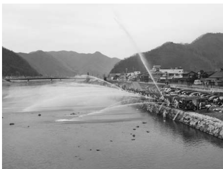
↑式典後のカラー放水