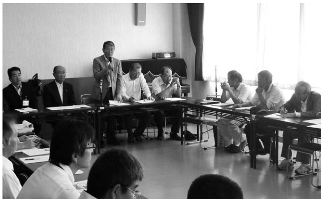
↑赤松地区で行われた地域別懇談会（10/12）

懇談会では、遠山町長がまちづくりに対する方針を述べ、また町からは財政状況説明が行われ、そして参加者からは、地域の課題である廃校利用や、定住促進のまちづくり事業などについて意見が寄せられました。