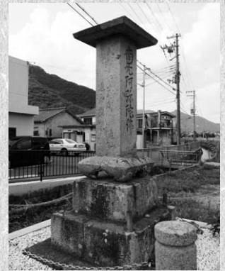
↑ 現在の大橋供養塔（井上） （山野里公民館から、大橋供養塔へは徒歩約20分）

この供養塔は、役場南、大持村土手上の旧渡し場対岸付近に置かれていましたが移され、現在は上郡中学校の跡地にのこされています。