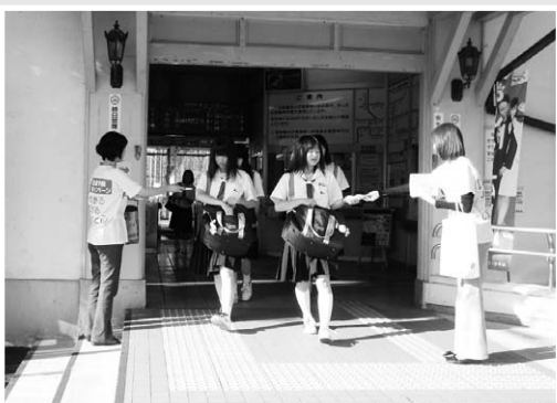
↑上郡駅前でのティッシュ配り

上郡駅前で赤穂健康福祉事務所・上郡町保健センター職員により、相談機関の名前・電話番号入り自殺予防キャンペーン用ティッシュを配布しました。通勤中の方や高校生に約600個のティッシュを手渡しました。