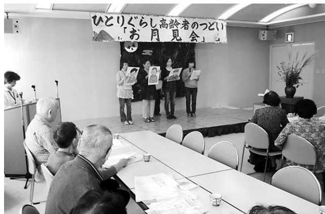
↑ 暮らしの安全・安心推進員による寸劇の様子