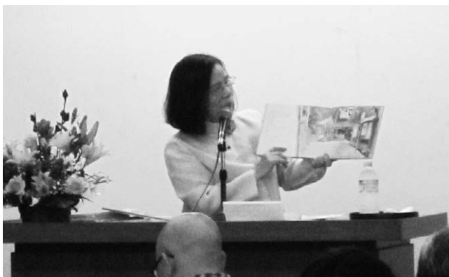
↑ 中ホールで行われたので、講師を身近に感じられる講演会となりました

そして、絵本『とんことり』の読み聞かせも行われ、参加者からは「作者の思いが伝わり、作品をより深く理解できた」などと感想が寄せられました。