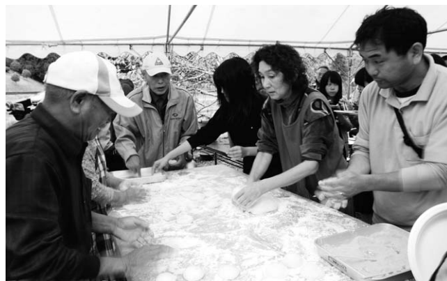
↑ つき立てのお餅を丸めて、形を整える参加者