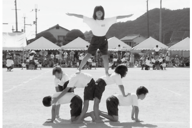
↓ 上郡小の児童による組体操