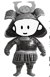
↑ 赤松の郷昆虫文化館