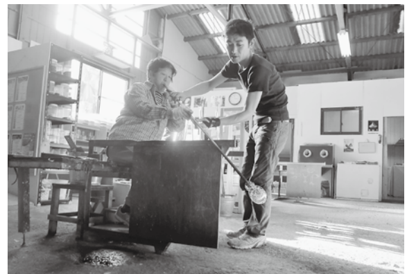
↑ 昨年の吹きガラス体験の様子

赤穂市、上郡町、備前市の観光協会が連携し、12月から平成25年3月までの間に圏域の観光資源を巡る8つのまち歩きツアーを計画しました。上郡町で行う「勾玉づくりと吹きガラスを体験するモロどんツアー」は、昨年に引き続き行う1日限定6人の貴重な体験ツアーです。その他、赤穂市、備前市をめぐるツアーは産業振興課・観光案内所などにあるチラシまたは町ホームページをご覧ください。