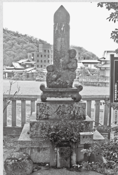
↑ 正訓堂筆塚(上郡天満神社境内)

これらの筆塚で顕彰された3人の他にも、町内では多くの文化人・教育者が、江戸時代後期から幕末にかけて寺子屋を開き、庶民の子弟の教育にたずさわりました。