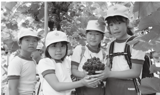
↑ 立派なぶどうを持って笑顔の児童たち