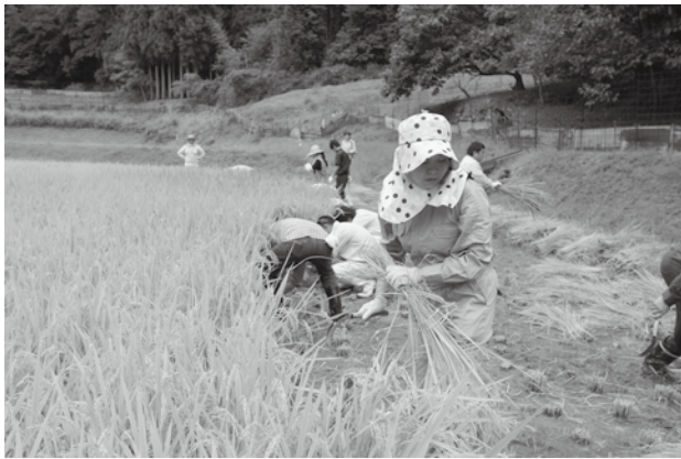
↑ 稲を刈るオーナーたち

参加者は「手で稲を刈るのはとても大変ですが、収穫の喜びを実感できた」とさわやかに汗を流していました。