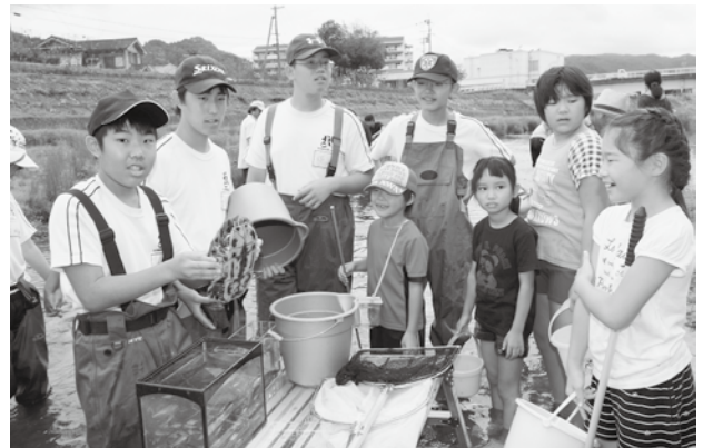
↓ 捕獲した生物を観察する児童ら

同月23日には、町内の各小学校で体育大会が行われました。統合して初めての体育大会を迎えた上郡小学校では、児童235人が元気いっぱいに演技。なごやかな雰囲気の中、交流を深めていました。