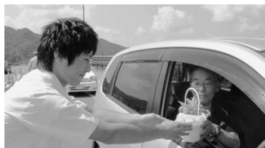
←花の苗を配布する生徒