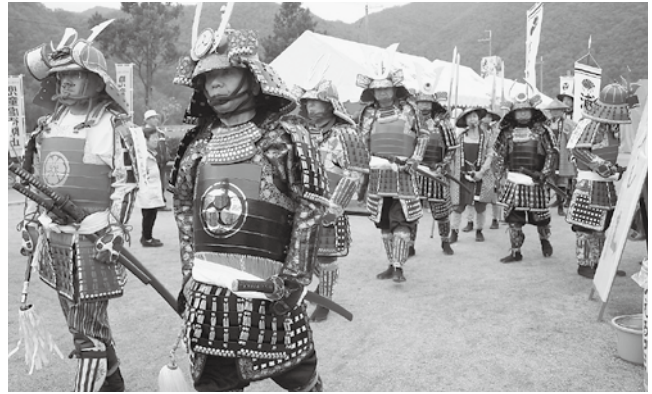
↑ 昨年の白旗城まつりでの武者行列

赤松円心ゆかりの地で、歴史と自然にふれながら千種川のほとりを散策。ゴール地点の「白旗城まつり」では、手づくりよろいカブトと秋の味覚が皆さんをお迎えます。法雲寺の「円心坐像」と菩提樹「ビヤクシン」、昆虫文化館のコレクションは一見の価値あり！