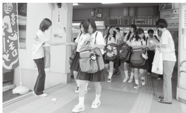
駅前でのティッシュ配布の様子