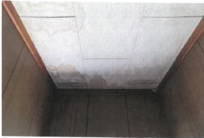
雨漏り状況(1階 内部)