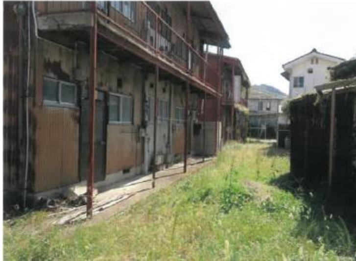
北方より敷地西側を撮影