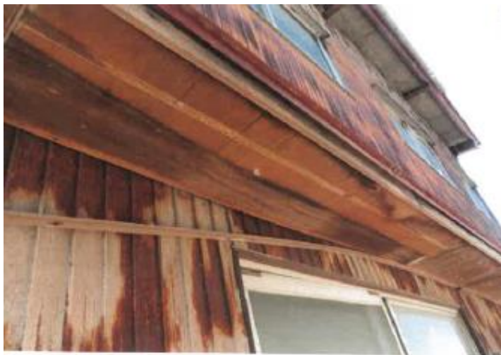
損傷箇所、発錆状況