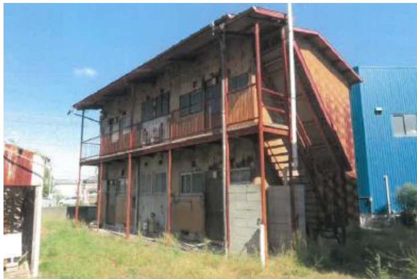
敷地南西部より撮影(建物全景)