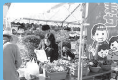
令和7年11月23日 赤松歴史まつり

生徒からは、「実習を通して、町の農業は自然環境に支えられていると感じた」「野菜や卵を販売する中で、地域の皆さんに支えられていることを実感した」といった声が聞かれました。