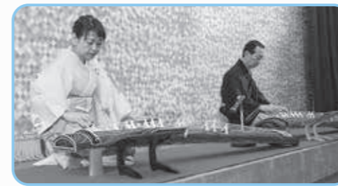
山と風の邦楽グループ

1月11日(日)、生涯学習支援センターで「令和8年 二十歳のつどい」が開催され、87人がりりしいスーツや華やかな振袖姿などで出席しました。二十歳の門出を祝う円心太鼓が演奏されたあと始まった式典では、小・中学校時代の先生からのお祝いメッセージがビデオレターとして会場に映し出されました。懐かしい恩師の姿と温かいメッセージに、二十歳の皆さんの笑顔があふれていました。