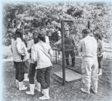
地元猟友会による獣害対策の授業

地元猟友会の方を講師に招き、獣害対策を学ぶ授業を実施。現場の知恵や技術を受け継ぎながら、地域農業の課題を考えました。