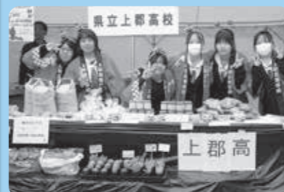
令和7年10月25日 西播磨フロンティア祭

話を聞いた生徒は「様々な実習に取り組むことがとても楽しく、たくさんの学びがある」「上郡高校は地域と密着して活動しており、お互いに協力し合いながら、町をより良くしたい」と話してくれました。