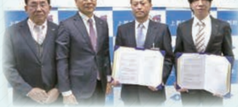
赤十字飛行隊兵庫支隊・上郡町 災害発生時等における緊急輸送等に係る協定締結式

今後は災害時だけでなく、防災訓練にも関わっていただけるよう連携を進めていきます。