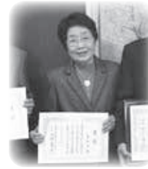
兵庫県老人クラブ連合会会長表彰 優良老人クラブ えいわかい 栄和会