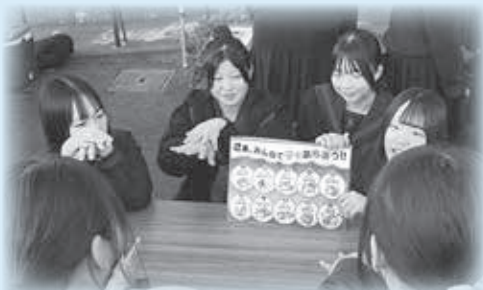
上郡駅前イルミネーション 上郡高校生のブース

かみごおり観光協会と協力し、駅前イルミネーションを制作。点灯式当日、ペットボトルを使ったランタン作り体験や、手洗い・うがいを呼びかける紙芝居を実施し、冬の駅前を賑やかに彩りました。