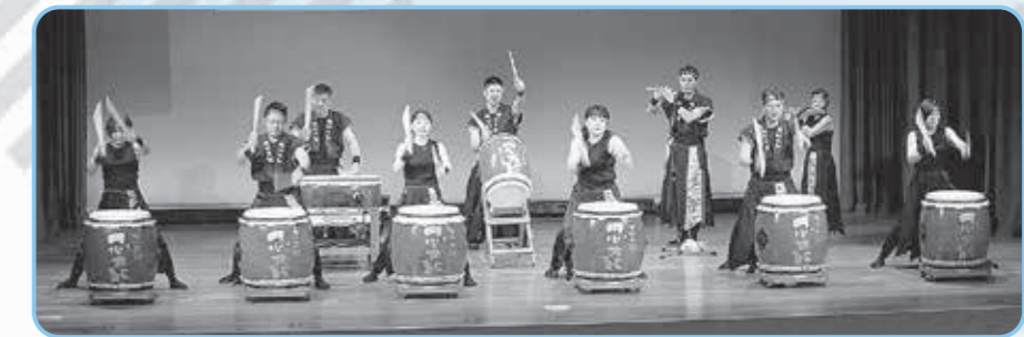
かみごおり円心太鼓