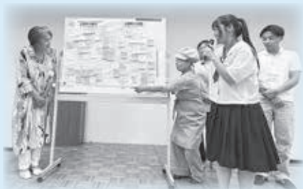
住民ワークショップで発表する様子

将来のまちづくりを考える総合計画の住民ワークショップに参加。9つのテーマに分かれて地域課題を整理し、意見交換や全体発表を行いました。若い視点で提案をまとめ、地域づくりを一緒に考えました。