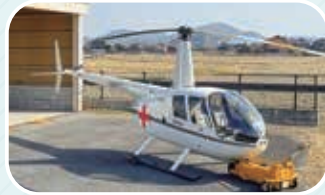
赤十字飛行隊所有のヘリコプター