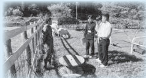
地域おこし協力隊への取材の様子

公務員志望の生徒が、町役場でインターンシップを経験。企画広報、地域振興、建設・土木の各分野に分かれ、業務の一端に触れました。行政の役割や情報発信の大切さを学び、進路選択にもつながる実践の場となりました。