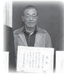
兵庫県知事表彰 優良老人クラブ くまみまろ 隈見町高齢クラブ