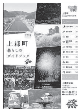
暮らしのガイドブック 表紙

2月末までに、委託業者が町内全世帯へポスト投函にて配布します。（ポストが見当たらない場合はインターホンを鳴らして手渡しします）