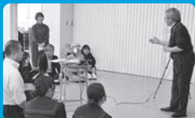
令和7年11月7日 校内での発表会

3年生の選択授業の一つである未来社会科では、「社会への歩み」と題して地域で様々な取組をされている方にインタビューをしています。それぞれがその内容をまとめ、発表会も行います。「直接話をお聞きして、学べたことがたくさんあった」と多くの生徒が話していました。