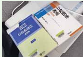
▲産廃問題の行政訴訟で参考にすべき書籍