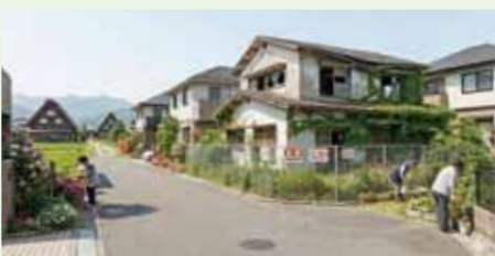
▲住宅街の危険老朽空家のイメージ

地図上の位置と施設の詳細データをコンピューター上で結び付け、一括して管理・活用する仕組みのこと。