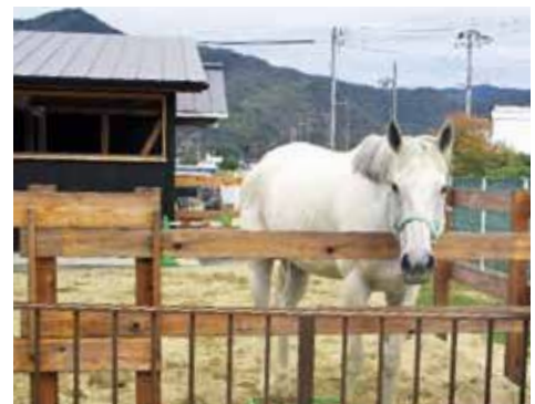
▲自然と共生で笑顔あふれるアポロファーム

要望 「重要度・満足度グラフ」の問題点として、「重要度」ではなく「関心度」という言葉に変えるべき。