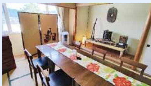
▲ピュアランドの改装された個室