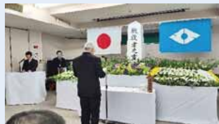
▲11月14日戦没者追悼式