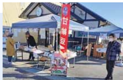
▲帰省客に向けふるさと納税をPR