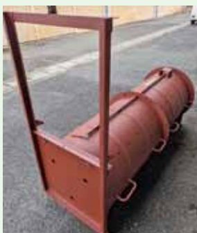
▲熊用ドラム缶捕獲檻

農林振興課長 本町についてはある程度状況を把握し、県と相談しその後の対応を検討している。