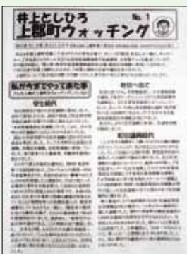
◀ 公職選挙法違反の疑いがあるチラシ

選挙管理委員会 確認したが、客観的事実と異なる記載があり、「虚偽の事項」に該当する可能性や「落選させたいものです」という記載から特定の候補者を当選させる目的が認められる場合、事前運動に該当するおそれがある。