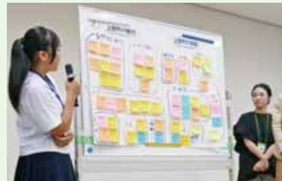
◀ワークショップ (10年後の上郡の姿を考えました)

町長 自治会役員や防災会議など女性参画の現状をデータ分析しているところである。直接女性の声を聞く機会についての今後の会議のあり方につなげたい。