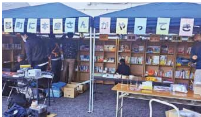
▲連携協定を結んだ(株)トーハンがぐんぐんフェスタにやってきた

議会定例会、議会運営委員会(2回)、総務文教常任委員会(4回)、民生建設常任委員会(6回)、広報特別委員会(4回)、第6次総合計画特別委員会(2回)、全員協議会、月例出納検査(3回)、ハラスメント研修、JIAM研修、県知事へ意見書提出、ピュアランド山の里視察、播磨高原広域事務組合議会視察研修、播磨高原広域事務組合定期監査、町村議会議長全国大会、国会議員との意見交換会、兵庫県町議会議長会臨時総会・議員研究会、監査委員全国研修会、西播磨市町議長会総会及び現地視察、たつの市制施行20周年記念式典、佐用町合併20周年記念式典、神河町制20周年記念式典、上郡町地域公共交通活性化協議会、川まつり全体会、上郡町障がい者問題懇話会総会、上郡町戦没者追悼式、高田小学校創立150周年記念式典、上郡高等学校創立120周年記念式典、上郡町町民スポーツ大会総合開会式、上郡高等学校体育大会、上郡中学校体育大会、播磨高原東中学校体育祭、ひょうご里山フェスタ2025、関西福祉大学地域連携フォーラム、ルポン国際音楽祭2025、赤松歴史まつり、ぐんぐんフェスタかみごおり2025、駅前イルミネーション点灯式、近隣市町親善剣道大会、健全会播但連合支部親睦競技大会