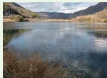
▲ 水系の水と環境を守り 次世代に引き継ぐ