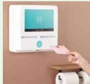
◀ 費用負担している企業のメッセージが流れた後生理用品を一枚無料で受け取れる「オイテル」