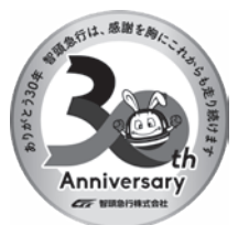
智頭急行開業30周年 ロゴマーク