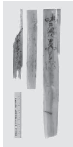
山野里宿遺跡出土呪符木簡 (赤外線写真・奈良文化財研究所撮影)

山野里宿遺跡で生活していた人たちも、きっといろいろな災難に悩まされて、厄除けがしたかったのだと思います。