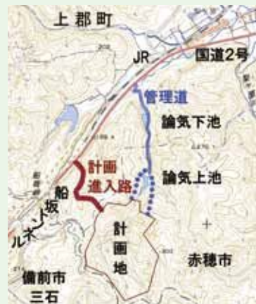
▲進入路が「事前協議書」の計画から論気谷管理道に？

町長 「事前協議書」と異なる進入路なら看過できない。昨年12月に赤穂市長とともに県に対して「この道が産廃用道路なら許すことができない」と強く申し入れた。