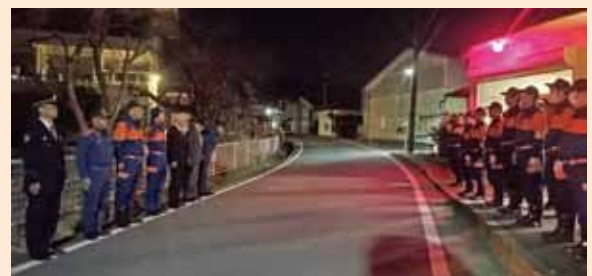
▲消防団年末夜警特別巡視