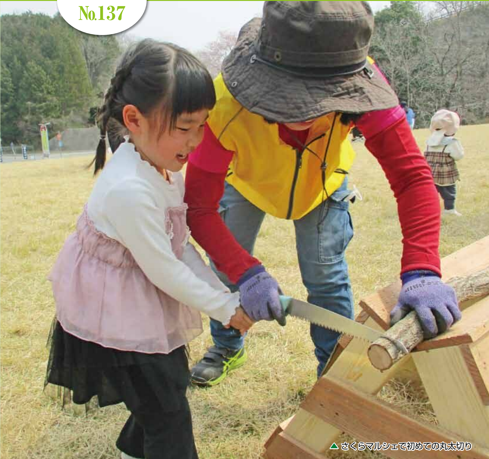
▲ さくらマルシェで初めての丸太切り

1万2,000円給付とピュアランド山の里グランドオープンへ! 令和8年度予算決定!