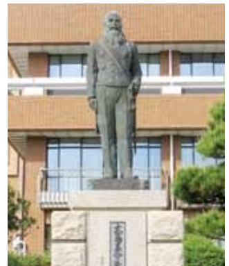
▲役場前の大鳥圭介像