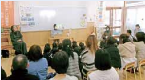
▲こども園有機給食の日の紙芝居