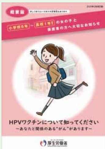
▲子宮頸がん予防についてのお知らせ (厚生労働省)