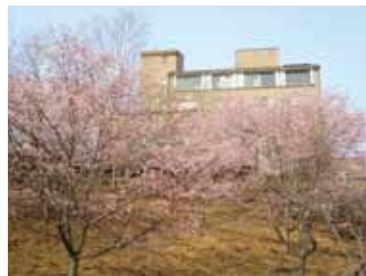
▲さくら園から望むピュアランド（河津桜）

意見 ピュアランドの再生は、地域振興や文化を含めた大きな構想になり得る。町の将来像を示す象徴的な事業として位置付けるべきである。