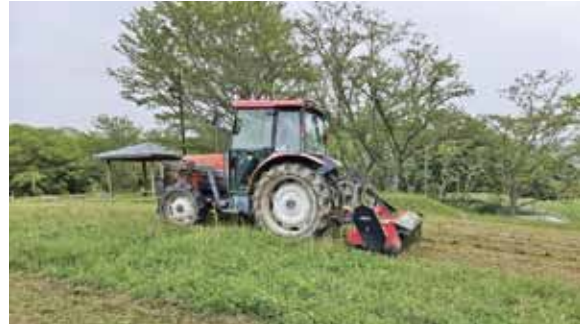
▲除草作業中の公営墓園