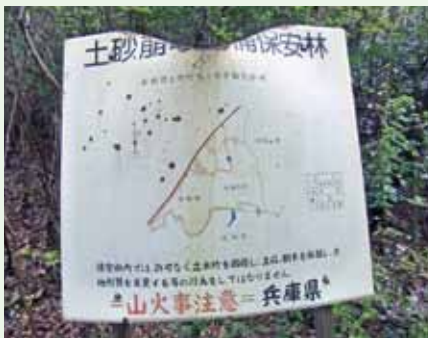
▲下池周辺は土砂崩壊防備保安林

町長 保安林解除についても、町は大変大きな事柄であるということは、十分に認識している。どう対応するかということも、町のほうで考えをしっかりと持っている。