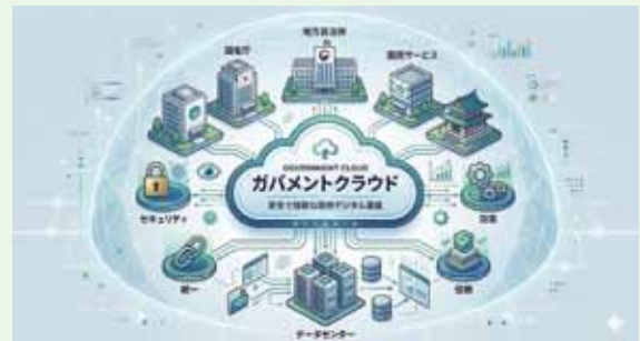
▲ガバメントクラウドのイメージ図

総務課長 システム移行費は国が全額負担するが、運用経費は町の負担となる。国は標準化によりシステム運用経費の3割削減を目標としていたが、実際には移行前と比較して経費の増加が見込まれるため、国に対して財政支援の充実を引き続き要請していく方針である。