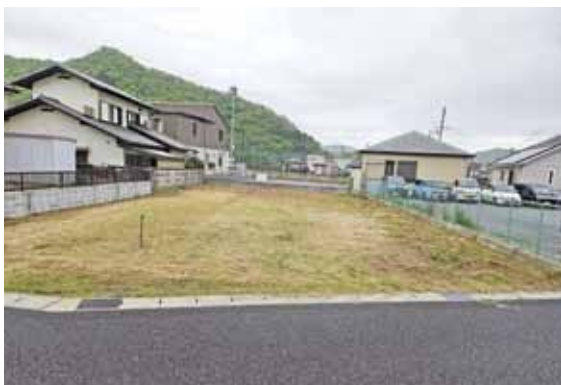
▲売払い予定の駅前町有地

答 実績は、駅前在先着順の土地1件と旧高田幼稚園敷地内道路。令和8年度予定地は、駅から徒歩5分以内の整形地3筆。広報誌やHPまた、看板等でPRしている。