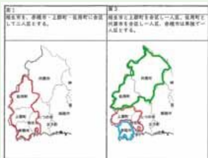
▲県議会議員区割り変更案