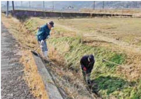
▲農地を維持するための共同活動

答 農業者や地域住民が共同で農地、水路、農道などの保安全管理を行う活動を国と自治体が支援する制度で、地域の共同活動を支え、農村環境を守ることを目的とする。町には49組織がある。