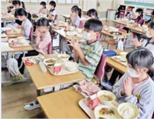
▲小学校給食風景の写真

4月からの学校給食費は値上げするが、小学校は国の交付金を活用し保護者負担は無償。中学校は国の制度の対象外だが、増額分等を町が補填し保護者負担額を現行の300円に据え置く。