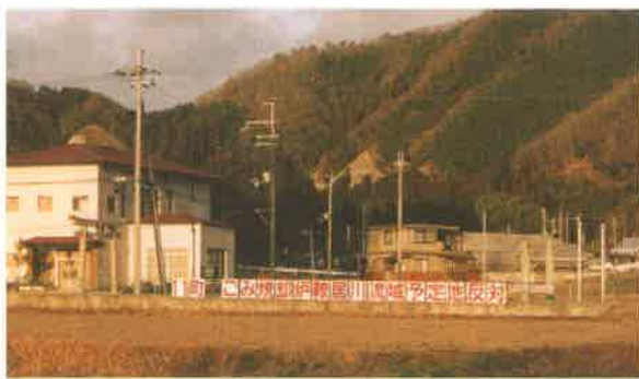
ゴミ処理場建設反対看板

問 播磨科学公園都市の成熟化にむけて相生、たつの、宍粟市等、交通面（バス）促進計画が活発に進められているので、上郡町においても取り