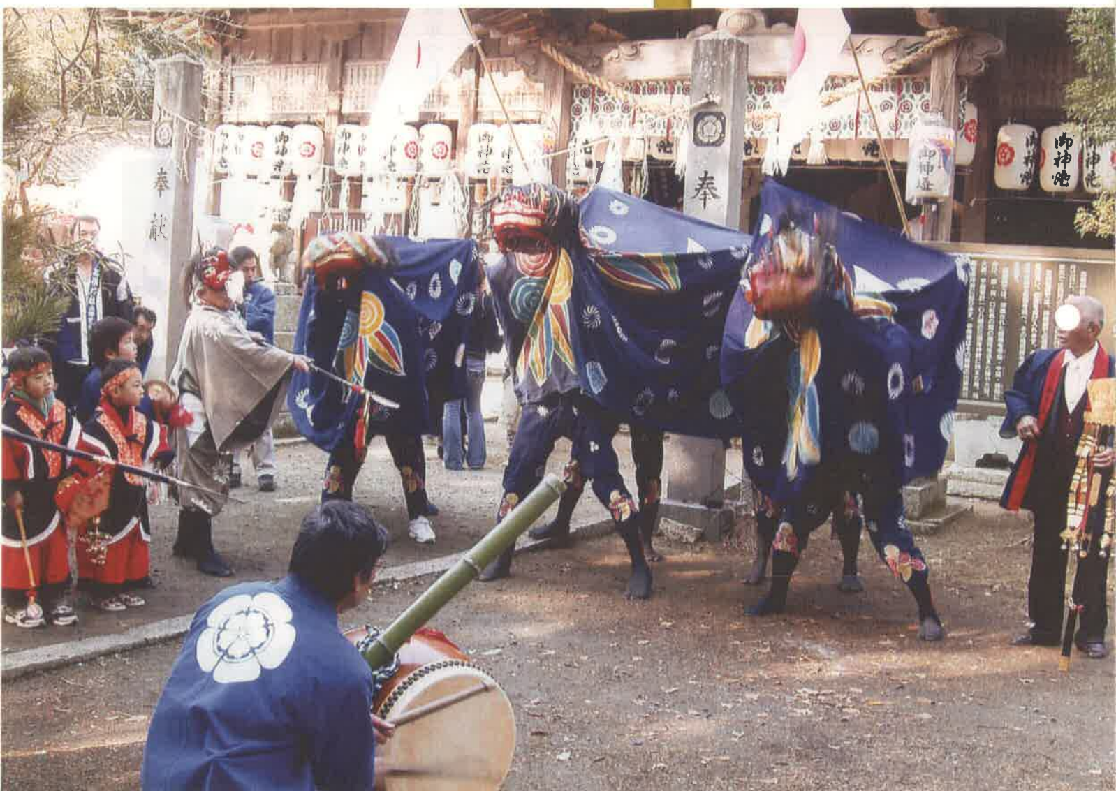
元旦獅子舞奉納（高嶺神社）