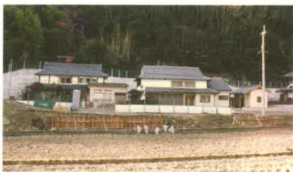
急傾斜地対策現場