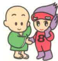
上部のマスコットキャラクター 円心くんとエイトちゃん