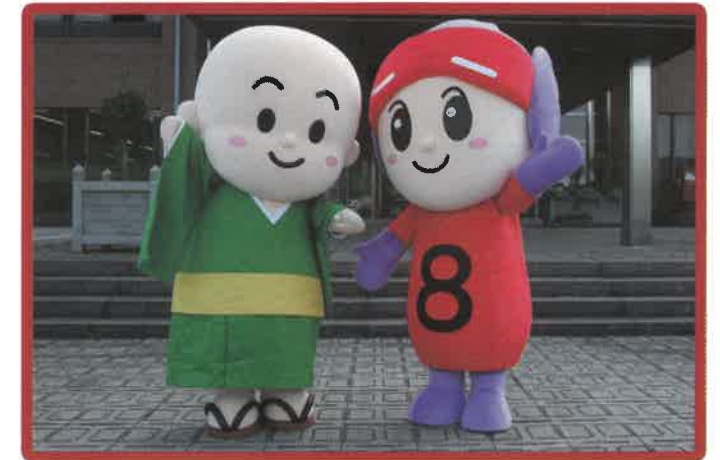
上郡町イメージキャラクター 円心くん エイトちゃん