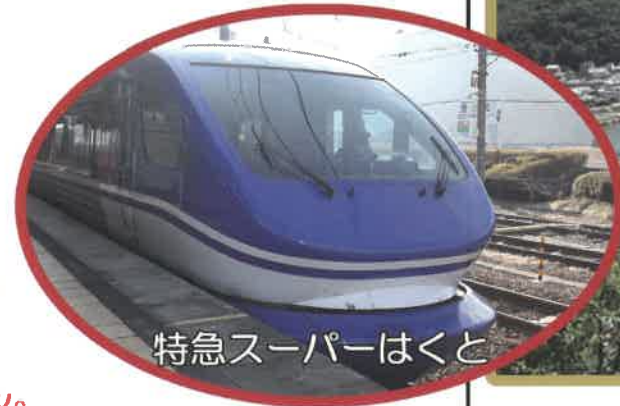
特急スーパーはくと

※豆知識 上郡町は終着駅です。 JR三ノ宮23時23分発に乗車すれば 上郡駅に0時35分着 終電なので寝過ごすことはありません。