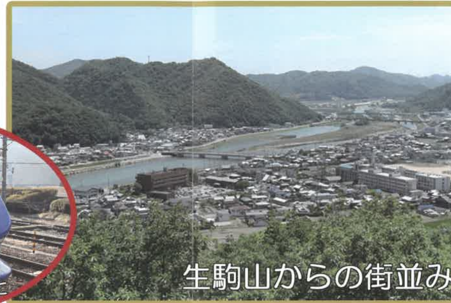
生駒山からの街並み

• 上郡町には子育て学習センター、認定こども園、保育所、公立幼稚園から小・中・高・大学までがあります。 小学校はスクールバスが利用可能です。 幼稚園と小学校には学校給食があります。 豊かな自然の中でのびのびと子育てができます。