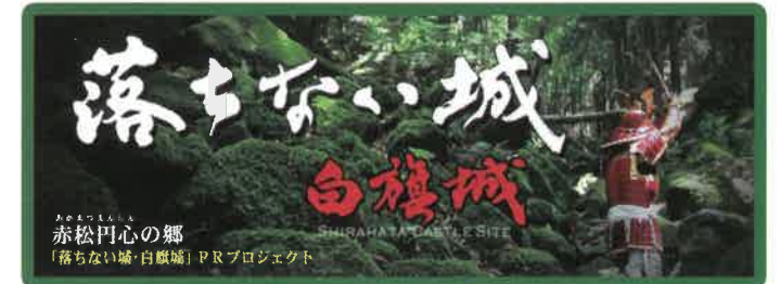
合格祈願スポット「落ちない城 白旗城」