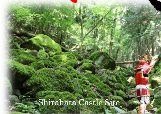
Shirahata Castle Site